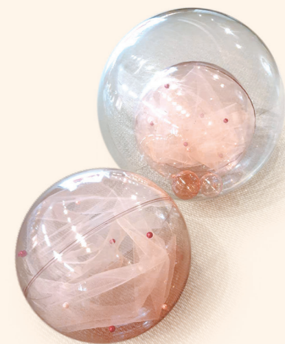
左圖 | 希望微光 | 2020 | 愛上藝廊